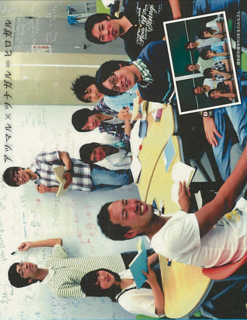
理学部附属学科3年生のみなさん