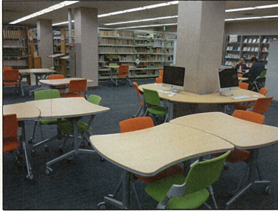
LCの設備(平成22年3月撮影)