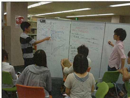
ホワイトボードを活用したグループディス カッションの様子