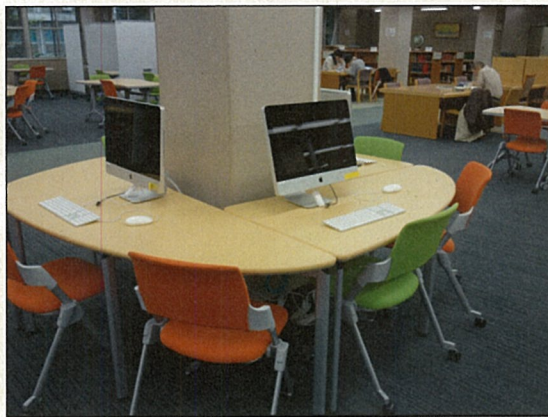
LCの設備(平成22年3月撮影)