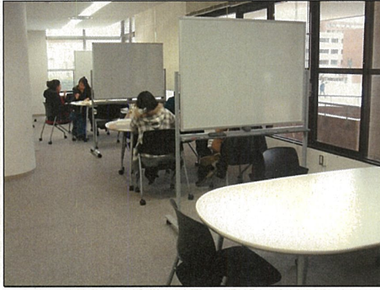
個室に近い状態で使えるコラボエリア。