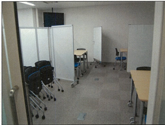
グループ学習や講習会に使えるコラボエリアのコミュニケーションルーム(半室はPC設置)。