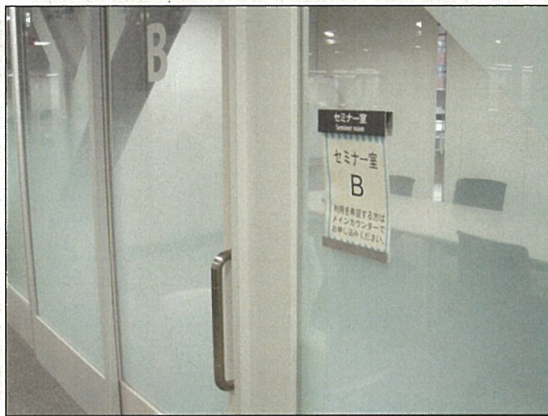
個室ではあるものの、外から見えるコラボエリアのセミナー室