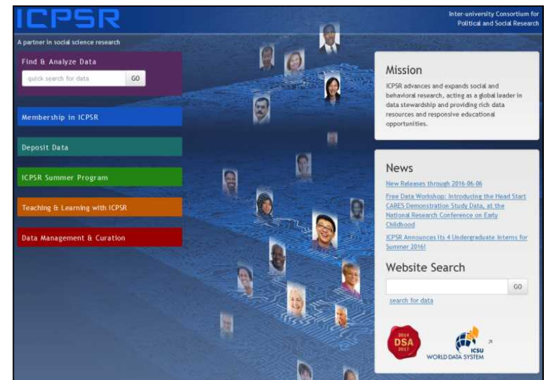
社会科学系の国際的コンソーシアムICPSR (サブジェクトリポジトリの例)